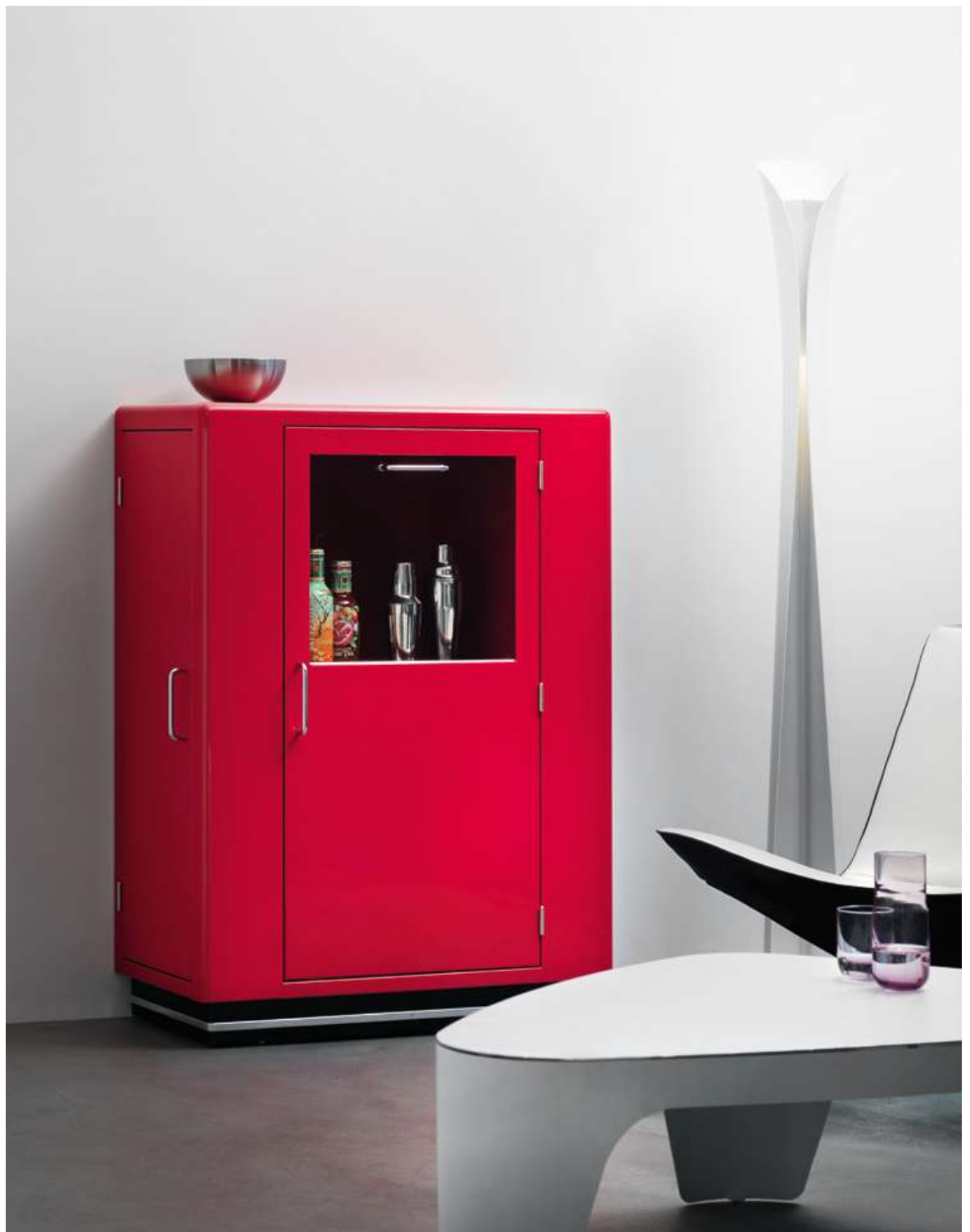
Barschrank KB 323 Bar cabinet KB 323

A highlight for your office or your home: The cleverly designed bar cabinet KB 323 is fitted with two side doors for holding your glassware and a large middle door with retractable glass panel. Even a refrigerator can be integrated if desired. Stylishly showcase the fine drinks you offer with additional interior lighting.