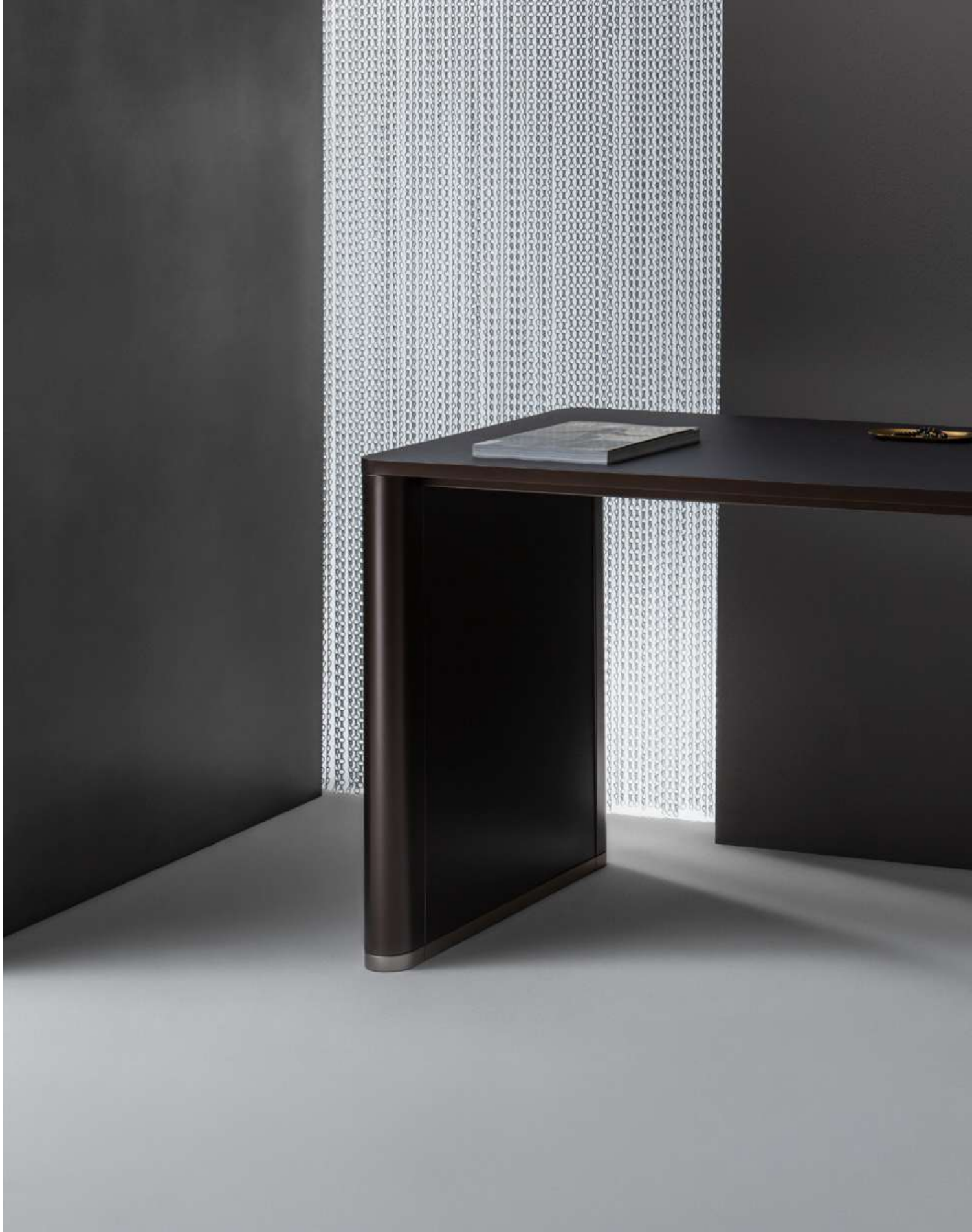
Schreibtisch T 50 Desk T 50