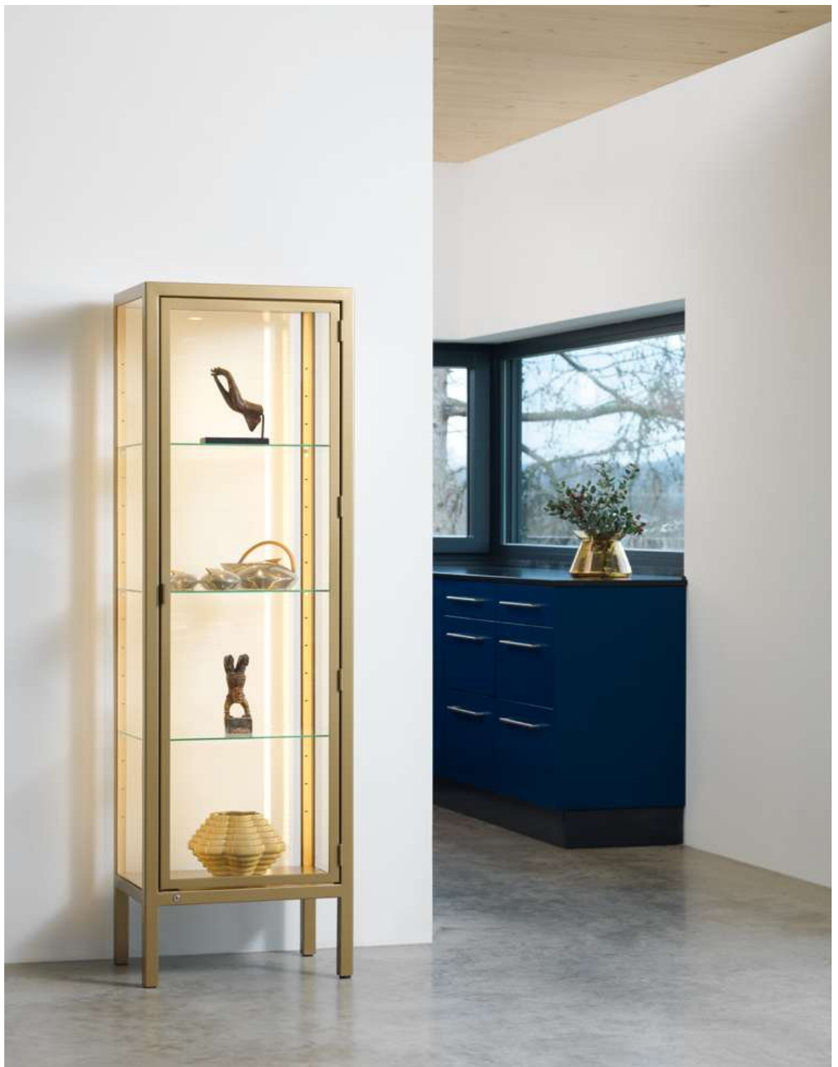
Glasvitrine GB 175 Glass cabinet GB 175

The marvels of beauty: What is the perfect place for showcasing your most beloved objects and turning them into a vision of delight on every day? Exactly – the transparent glass cabinet GB 175, shatterproof and yet airy, with safety glass on all four sides offering reliable protection. Fitted with a key-lock and prestigious interior LED lighting.