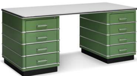
Sideboard SB 123

Various sizes and styles of our desks TB are ready for your selection: Will you opt for one or two pedestals at your workplace? Chrome-plated trims or a simple, unadorned style – what do you prefer? What kind of surface hue will blend harmoniously with the environment? The robust linoleum desktops are available in black or grey and additionally in further Forbo linoleum colours.