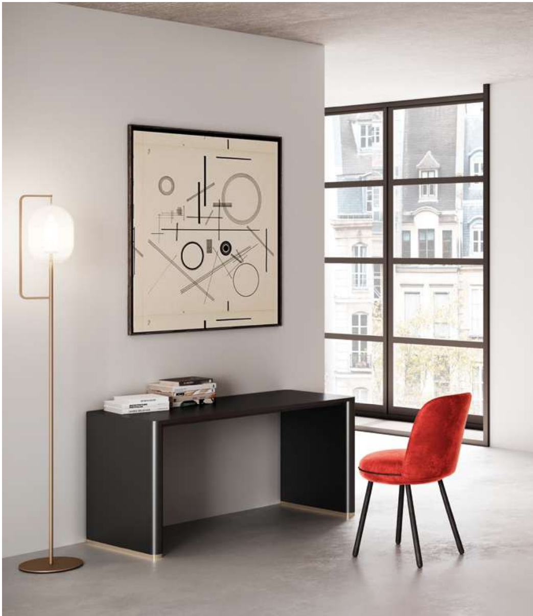
Schreibtisch T 50 Desk T 50