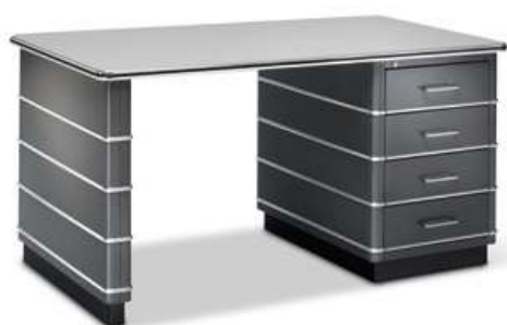
Schreibtisch TB 229 Desk TB 229