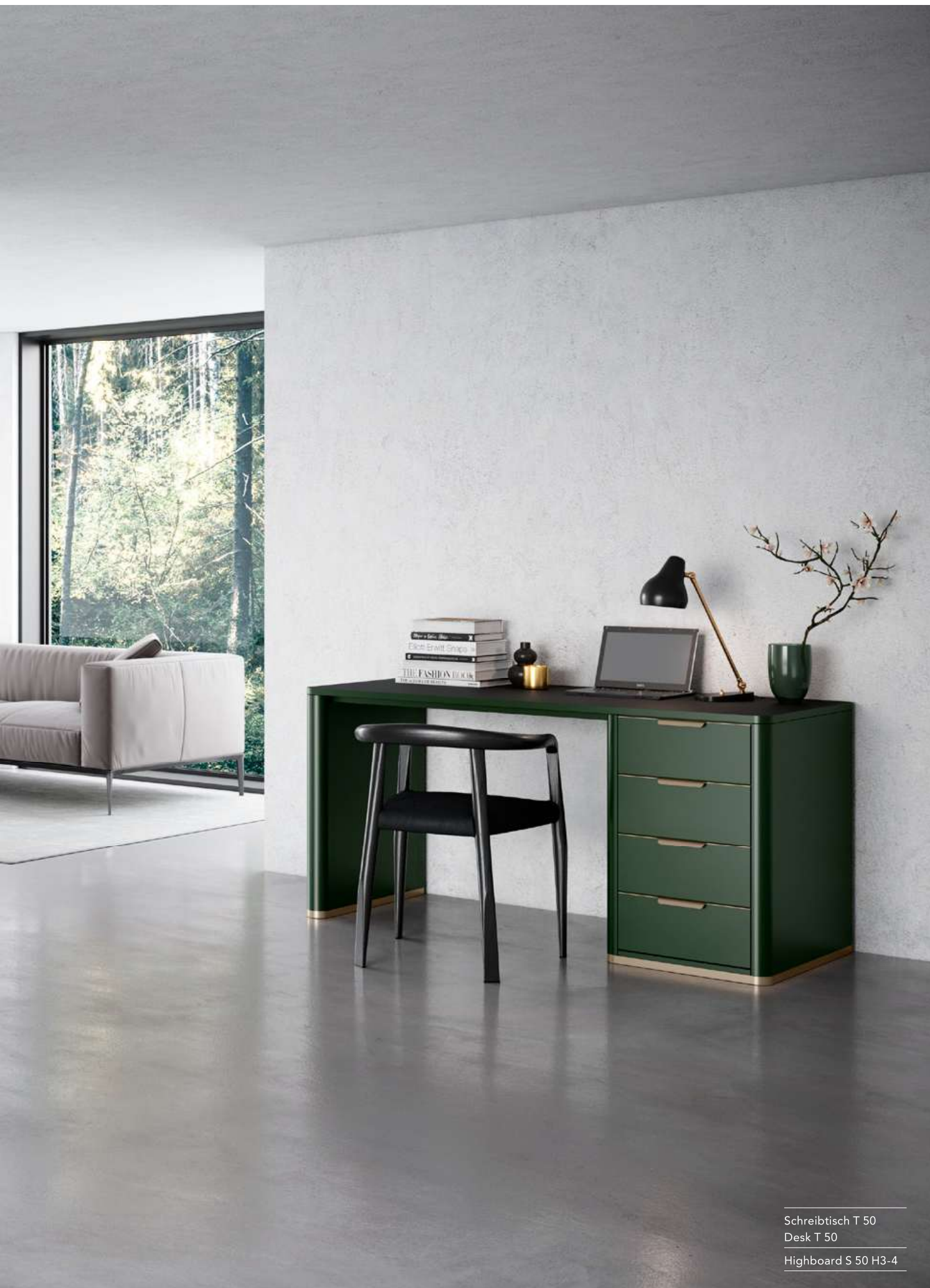
Schreibtisch T 50 Desk T 50 Highboard S 50 H3-4