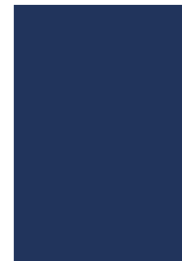
BLU BLUE BLEU

Per una corretta valutazione di tonalità e colore delle diverse finiture rappresentate a catalogo, è necessario fare riferimento ai campioni fisici.