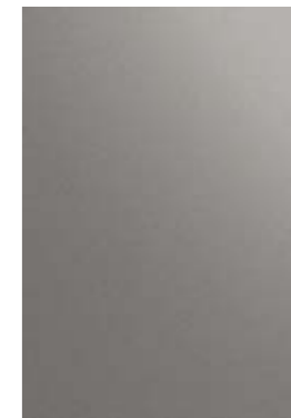
PELTRO PEWTER ÉTAÏN