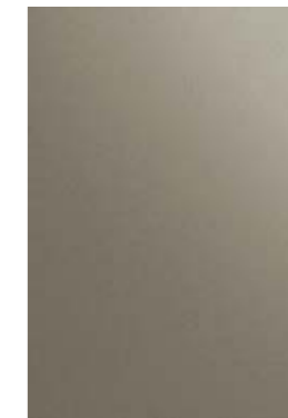
BRUNO OLIVA OLIVE BROWN OLIVE BRUN