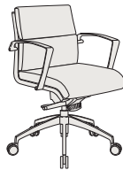
70420 h1035 . d680 . w680