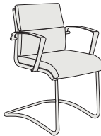
70450 h880 . d640 . w590